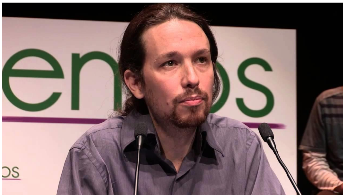
Pablo Iglesias Turrión, generalsekreterare i Podemos