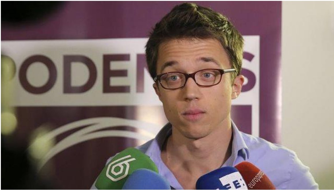
Statsvetaren Iñigo Errejón ingår i Podemos högsta ledning