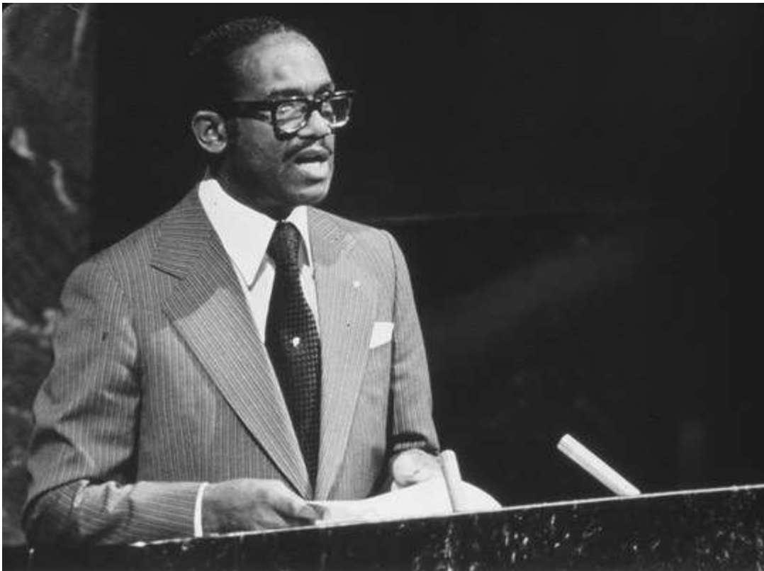
Eric Matthew Gairy

NJM hävdade att man var den enda kraft som kunde garantera äkta frihet och oberoende när England nu skulle släppa taget om Grenada. Gairy delade inte den uppfattningen och släppte lös sina blodhundar för att banka förstånd i de unga hetsporrarna. Men effekten blev inte den som Gairy tänkt utan den motsatta. Alla delar av samhället vände sig emot honom och krävde att regeringen tog ansvar för det brutala överfallet. Men Gairy tog inget större intryck av detta. I stället såg han till att parlamentet sammanträdde allt mer sporadiskt och attackerade den fria pressen och när allt fler ledare i den karibiska världen vände sig mot honom hittade han nya vänner — Chiles blodbesudlade diktator Augusto Pinochet kom på statsbesök 1976.