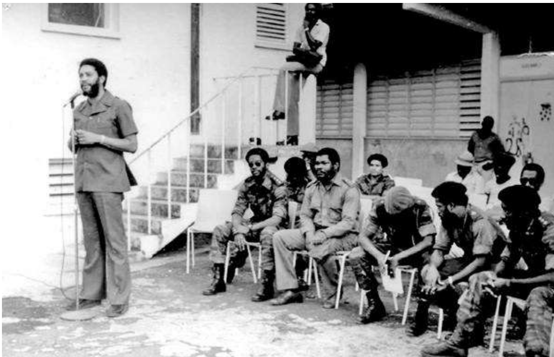
Bishop håller tal

I tidningen Internationalen skildrar en svensk solidaritetsgrupp hur revolutionsjubiléet firas på Grenada våren 1983 med militärparad och svängande calypsomusik. Stämningen är hög när vice premiärminister Bernard Coard talar och blir extatisk när han meddelar att Maurice Bishop just har landat på Grenadas nya flygplats efter en utlandsresa och snart kommer att ansluta till mötet.