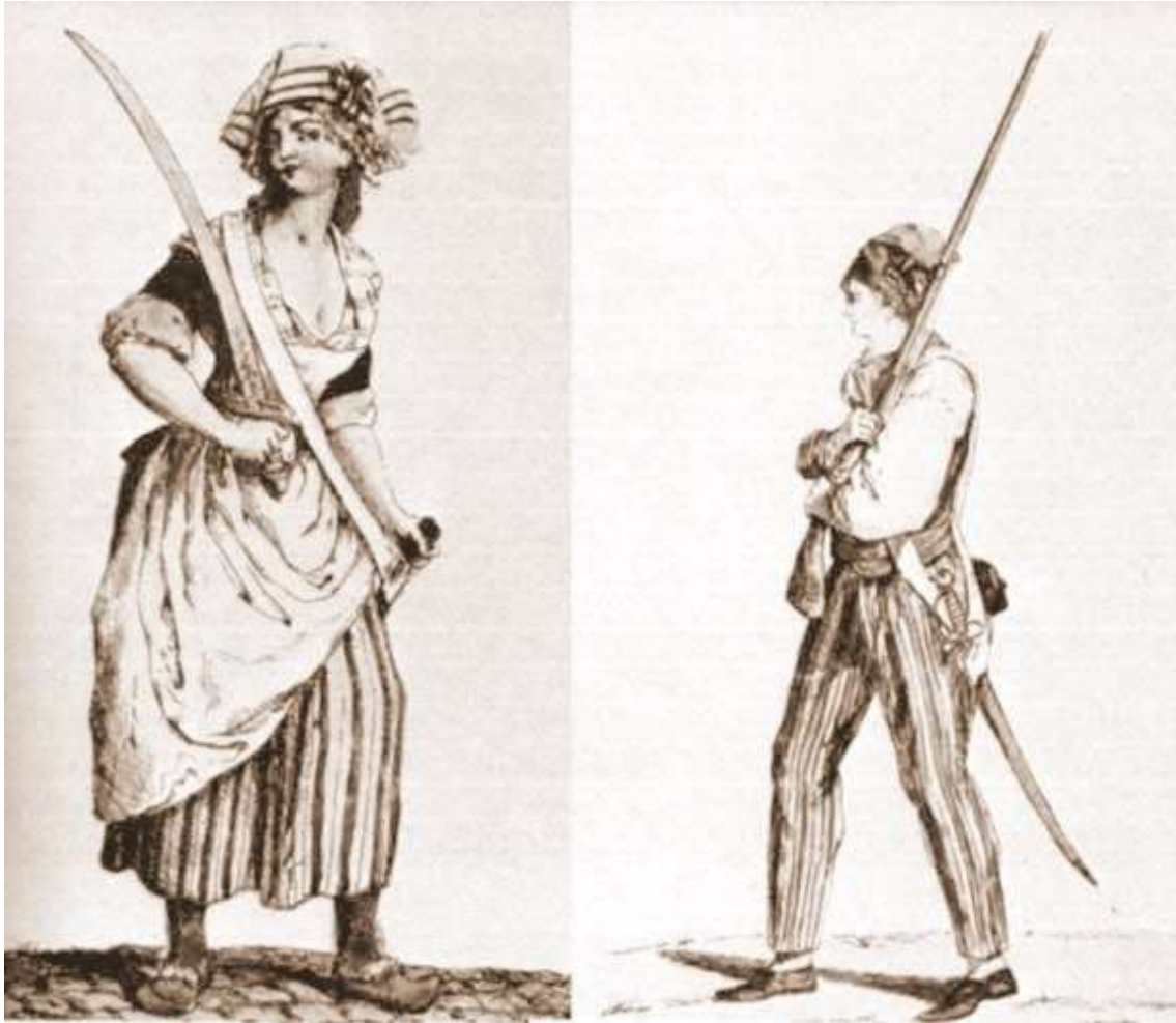
Sanskulotterna, vare sig kvinnor eller män, bar överklassens knäbyxor. Från franska "sansculottes", utan knäbyxor...