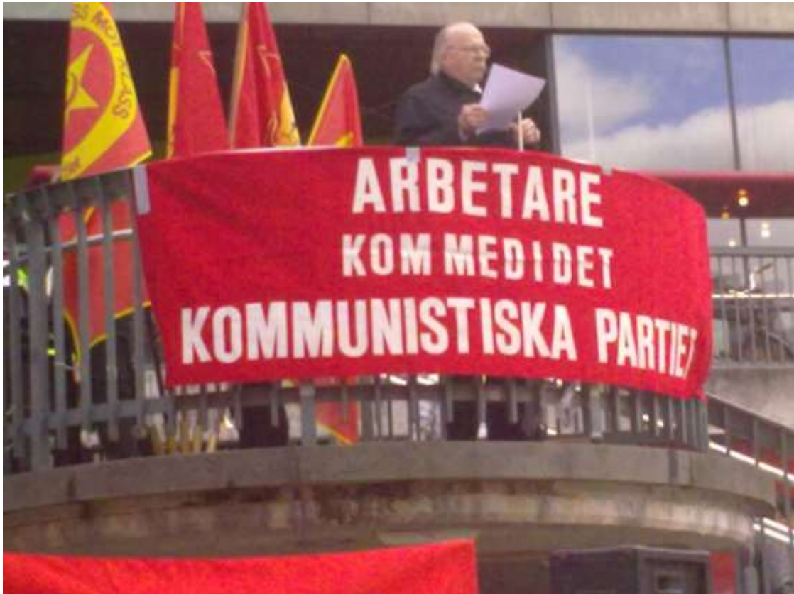
Jan Myrdal som politiker 1:a maj 2011

Bägge skorna klämmer. Både högerskon och vänsterskon. Ja, så illa att de inte längre duger ens att gå i.