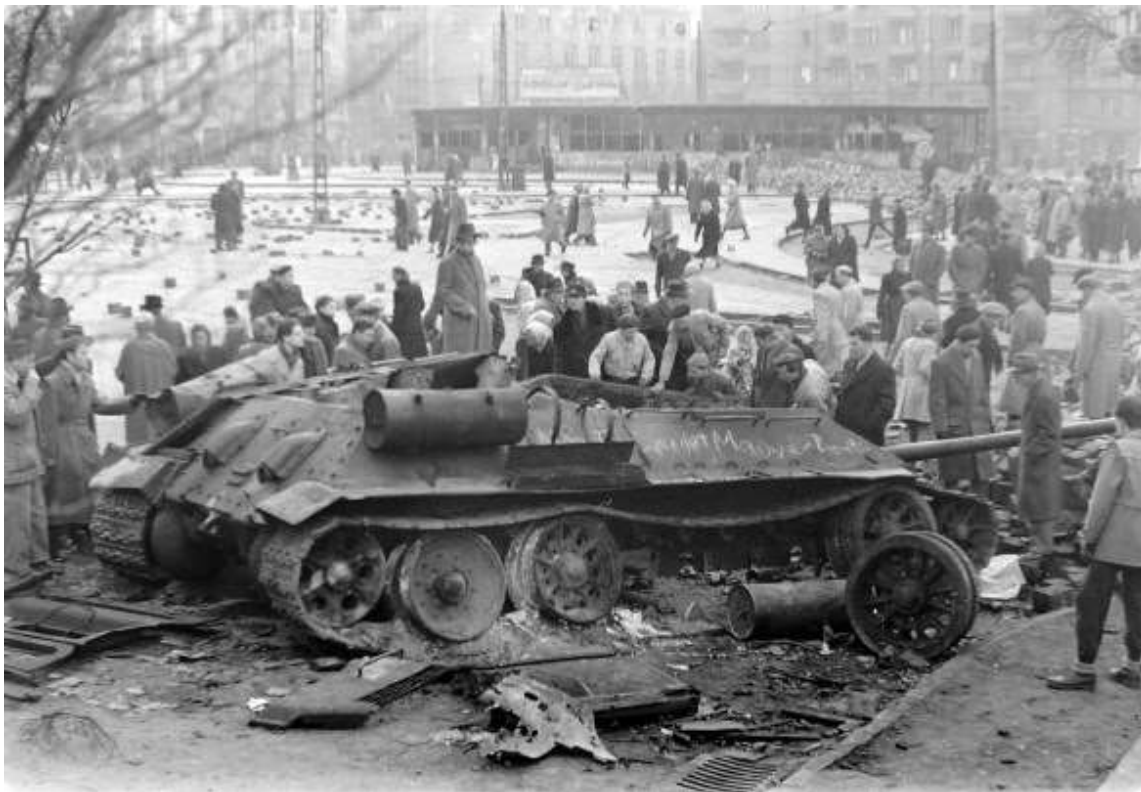
Civila som ser på en av de stridsvagnar som förstördes

Men i dag, den 4:e november, på dagen sextio år efter Warszawapaktens invasion av Ungern då det folkliga upproret mot stalinismen krossades, tränger dessa tankar på igen. I gryningen då för sextio år sedan inleddes Operation Virvelvind med att sovjetiskt flyg och artilleri bombade Budapest. Ledaren för den nya ungerska regering som bildats 26 oktober, Imre Nagy, kunde höras i radion redan 4.20 om morgonen. Men hans tal bröts. Därefter sändes bara SOS-signaler ut för att avbrytas 8.15 då radiostationen togs över av Röda Armén.