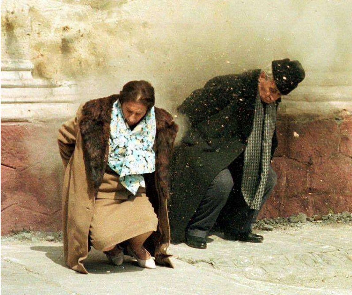
Avrättningen av paret Ceaușescu

Men dessa förutsättningar förstördes av den stalinistiska kontrarevolutionen. Alla är i dag överens om att vi upplevt en politisk revolution i Rumänien, med Ceaușescus avrättning som dramatisk kulmen. Men då ska vi också minnas att i 1930-talets Sovjetunionen likviderades hela bolsjevikpartiets ledning! Hundratusentals oppositionella avrättades eller dukade under i Gulag. Miljoner människor dog när en parasitär byråkratiserade all makt i sina egna händer!