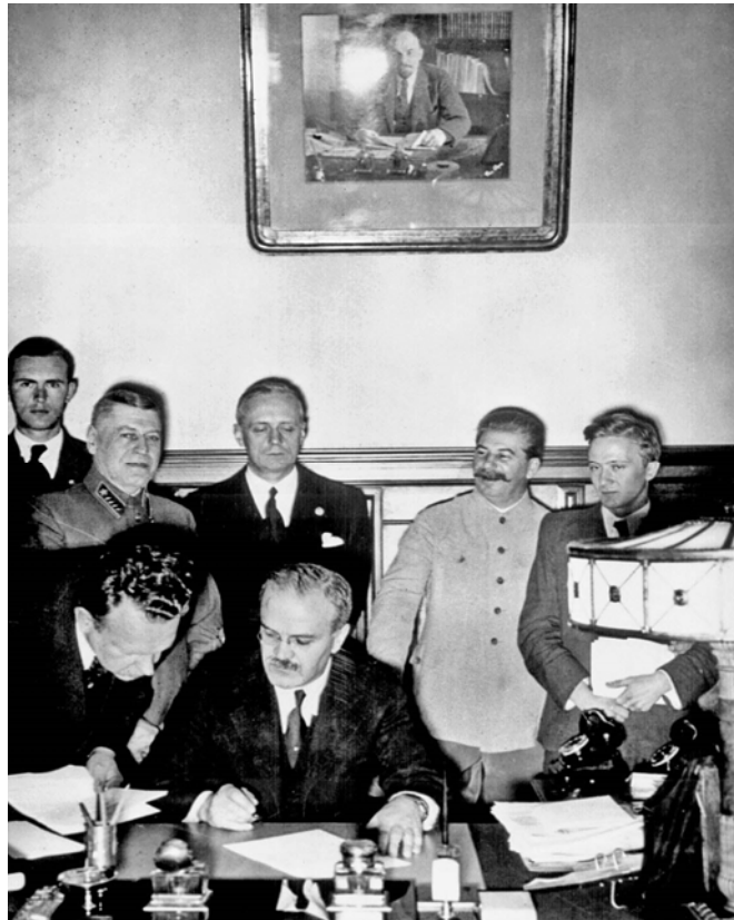
Molotov undertecknar paktens. Bakom honom von Ribbentrop och Stalin

Efter några veckors förvirrade försök att sitta på båda stolarna – att både mana till kamp mot Hitler och försvara Stalins pakt med honom – föll kommunistpartiernas ledare in i ledet och började fördöma det ”orättfärdiga imperialistiska kriget” och jämställa de krigförande parterna – om inte rent av urskulda Hitlers ansvar – i fullständig kontrast till sin tidigare hållning där nazi-regimen utpekats som en av de främsta krigshetsarna.