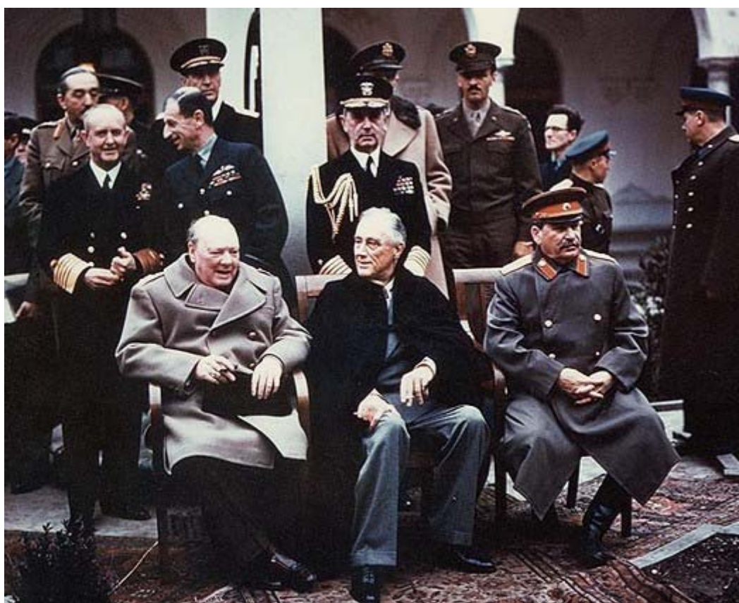
Churchill, Roosevelt och Stalin vid Jalta-konferensen i februari 1945