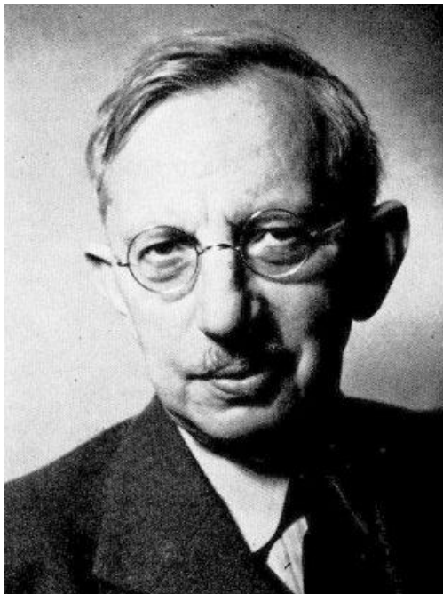
”Zäta” Zeth Höglund var ledare för den socialdemokratiska vänstern och senare även det svenska kommunistpartiet

Den 20 februari inbjöd riksdagsgruppens minoritet tillsammans med minoritetens kongressdelegater till bildandet av ett nytt parti. I maj konstituerades det nya partiet som antog namnet Sveriges Socialdemokratiska Vänsterparti (SSV) med Zeth Höglund som partiledare.