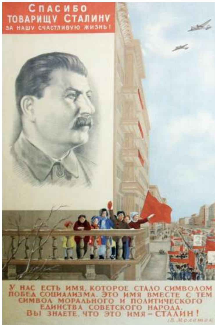
Affisch från 1940. Längst upp står: "Tack kamrat Stalin för vårt lyckliga liv!"

Ett märkligt resonemang. Det torde knappast vara obekant att marxismen gör anspråk på att stå på en materialistisk vetenskaplig grund där religiösa känslor, fördomar och villfarelser inte hör hemma och att marxister därför från allra första början strävat efter att skingra religiösa och andra ideologiska dimridåer, såsom förhärligande och dyrkan av enskilda personer. Att då hävda att personkult kan vara OK under uppbygget av socialismen, för att främja sammanhållningen i ett instabilt samhälle, är minst sagt anmärkningsvärt. Borde inte sådana för socialismen främjande medel inverka menligt på resultatet och motverka de socialistiska idealen? Socialism och kommunism innebär människans frigörelse på alla plan, och i det ingår frigörelse från alla slags religiösa och andra ovetenskapliga vanföreställningar.