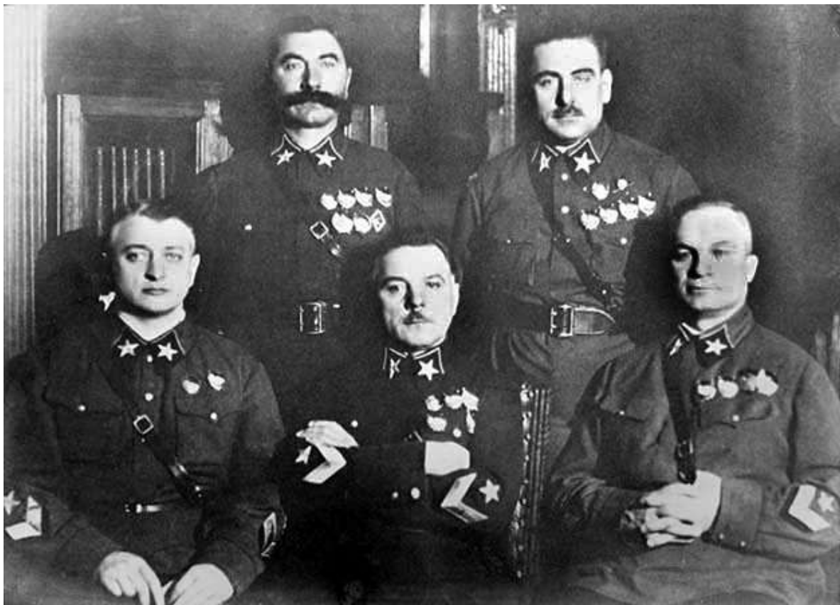
De första fem sovjetiska marskalkarna (1935). Främre raden (från vänster): Tuchatjevskij, Kliment Vorosjilov och Vasilij Blücher. Bakre raden: Semjon Budjonnyj och Alexander Jegorov. Av dessa överlevde bara Budjonnyj och Vorosjilov utrensningarna.