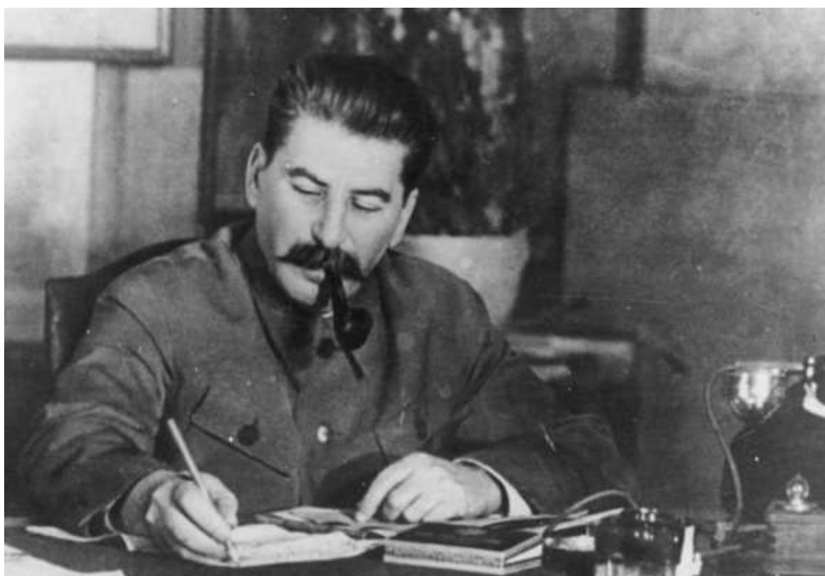
Socialismens hjälte eller dödgrävare?