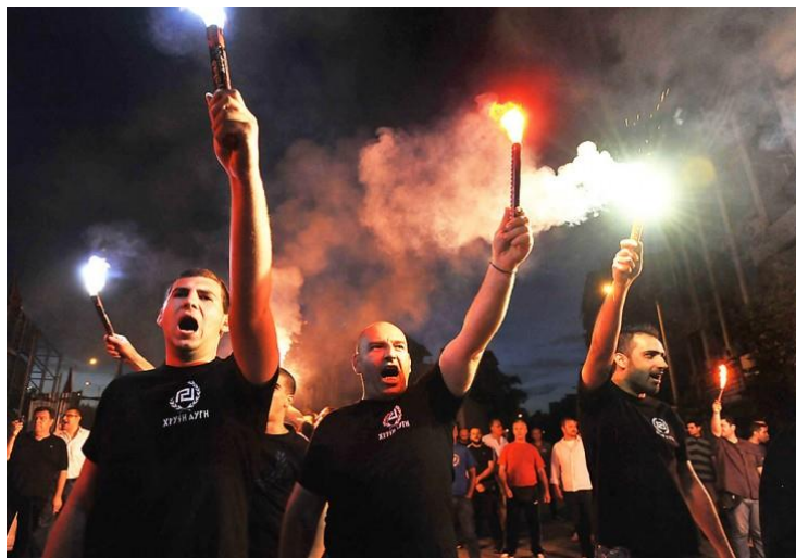
Gyllene gryning firar valframgångar i maj 2013

Detta har visat sig såväl vid opinionsmätningar som vid val, på Internet och i andra sammanhang. I Sverige har vi t ex Sverigedemokraterna (SD, 12% enligt aktuella opinionsundersökningar), i Norge Fremskrittspartiet (16% i senaste valet – nu på väg in i regeringen), i Finland Sannfinländarna (19% i senaste riksdagsvalet) och i Danmark Dansk Folkeparti (13%).