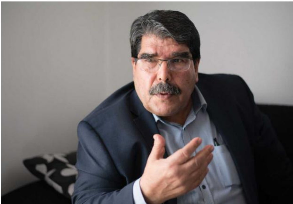
Salih Muslim är ledare för PYD.

Vad säger syriskkurdiska PYD om terrorismen, Rysslands militära inblandning och Assadregeringen?