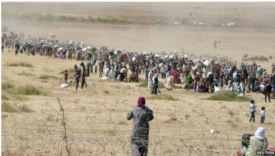
Över 4 miljoner människor har flytt ut ur Syrien