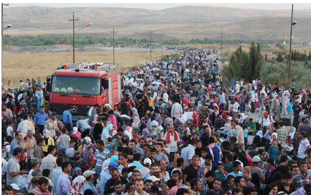
Syriska flyktingar strömmar in i Iraks kurdiska region (foto från 17 aug)