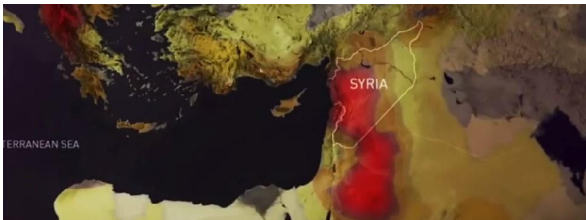
Område med extrem hetta/torka ("hotspot") i Mellanöstern. 10

Bland de omständigheter som gör det osannolikt att perioden av torka som startade 2006 skulle bero på slumpmässiga vädervariationer kan nämnas det faktum att det förvisso funnits perioder av torka förut, men inte någon som liknar den senaste. Under förra seklet (1900-2005) förekom således sex svåra torkperioder, där nederbörden under regnperioden sjönk till ungefär en tredjedel av den normala. Av dem varade fem bara ett år, den sjätte två år. Den som började 2006 fortsatte däremot år efter år. Vissa forskare menar att den senaste är den värsta sedan jordbrukscivilisationen började för flera tusen år sedan. 9