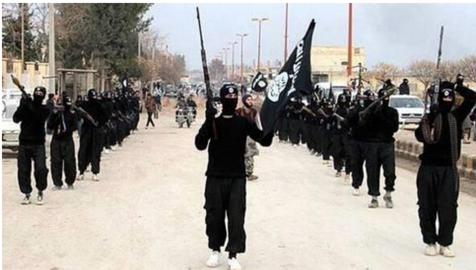
IS på marsch i syriska staden Raqqa

Argumenten mot Sveriges vapensamarbete med Saudiarabien har varit många, starka och övertygande. Det är en despotisk kvinnoförtryckande stat utan demokrati eller fackliga rättigheter. Prygel, amputationer och halshuggningar tillämpas systematiskt mot oliktankande eller homosexuella.