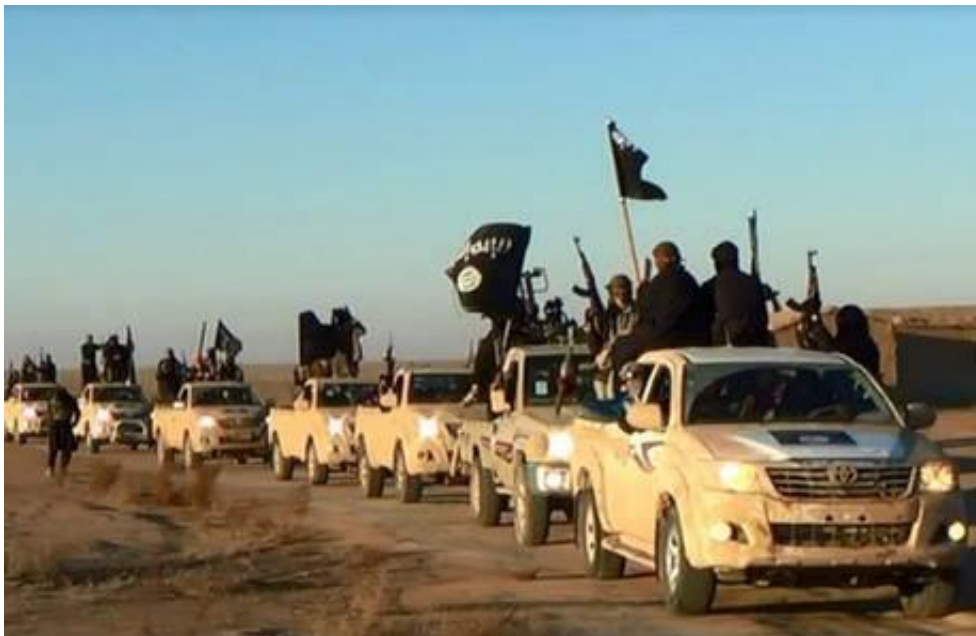
Konvoj med ISIS-militanter i Fallujah

De båda historierna belyser en viktig politisk sanning om dagens Irak. Varken regeringen eller någon av de etablerade politiska rörelserna är lika starka som de påstår sig vara. Makten är uppsplittrad och denna splittring har gjort att al-Qaida i Irak kunnat återkomma långt starkare och mycket snabbare än någon väntat sig. Dess jihadistiska aktivister är kvar i Fallujah, där de uppges ha mellan 300 och 500 man beväpnade med höghastighetsgevär för krypskyttar i utkanterna av staden. De har politisk medvind och de fredliga protesterna tynar.