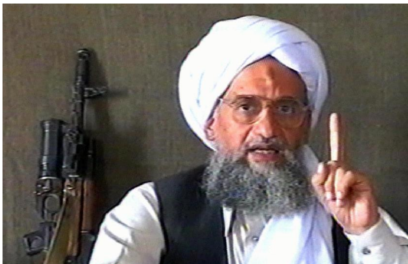
Egyptiern Ayman al-Zawahiri är idag al-Qaidas högste ledare

allierade. De som undanröjs ges ofta närmast militära gradbeteckningar som ”chef för operationerna” för att förstärka betydelsen av att de dödsdöms. Kulmen på, och den mest omtalade, denna till stora delar betydelselösa aspekt av ”kriget mot terrorism” var dödsdöms av Bin Laden i Abbottabad i Pakistan 2011. Detta gjorde att president Obama inför allmänheten i USA kunde göra ett stort nummer av att vara den som lett jakten på ledaren för al-Qaida. I själva verket hade hans död ingen inverkan på al-Qaida-liknande jihadistgrupper, som gått framåt mest efter 2011.