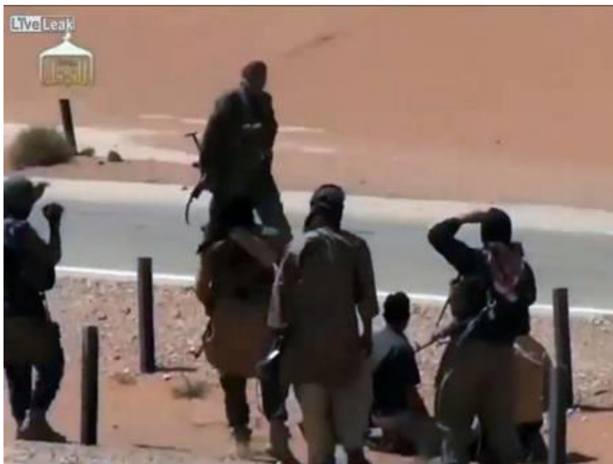
Alla tre lastbilsförarna dödas för att de inte är sunnimuslimer

"Vad gör alawiterna med Syriens heder?", frågar den beväpnade mannen retoriskt och under tiden har några andra män anslutit sig. "De våldtar kvinnor och dödar muslimer. På er låter det som ni är polyteister." De tre lastbilsförarna förs till väggkanten och det hörs skottlossning när de dödas.