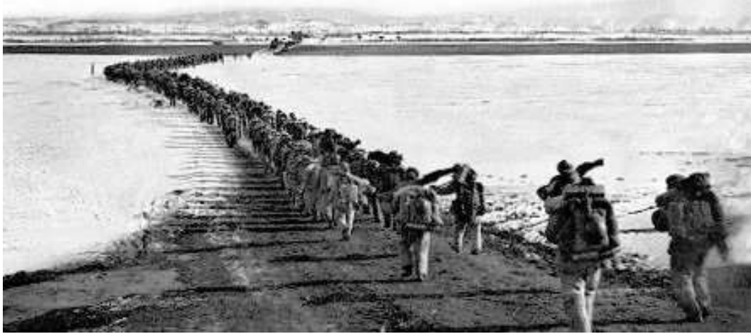
I oktober 1950 ingrep kinesiska trupper i Koreakriget (här korsar de Yalu-floden)

Koreakriget startade i slutet av juni 1950 och pågick till slutet av juli 1953, då man slöt vapenstillestånd, vilket fortfarande gäller, dvs något fredsfördrag har ännu inte undertecknats.