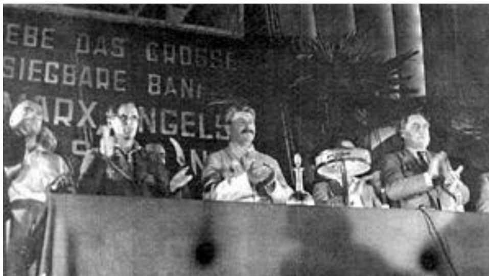
Stalin och Dimitrov vid Kominterns 7:e kongress 1935

I den mån det finns ett korn av sanning i detta påstående, ligger ansvaret för en situation i vilken kampen för arbetarklassens makt hamnat långt ned på dagordningen – i det imperialistiska sönderfallets och den sociala revolutionen era – hos den reformistiska socialdemokratin och stalinismens inte mindre förrädiska politik. Men den slutsats som stalinisterna drar avviker bara med en hårsman från de slutsatser som socialdemokraterna har dragit i årtal.