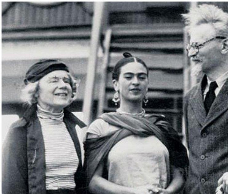
Natalia Sedova, Frida Kahlo och Trotskij