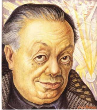
Diego Rivera – ett självporträtt

Det finns inget eller mycket litet som tyder på att Rivera skulle ha brutit med Trotskij av svartsjuka, hämndbegär eller liknande. Historiska fakta implicerar att brytningen främst hade politiska orsaker.