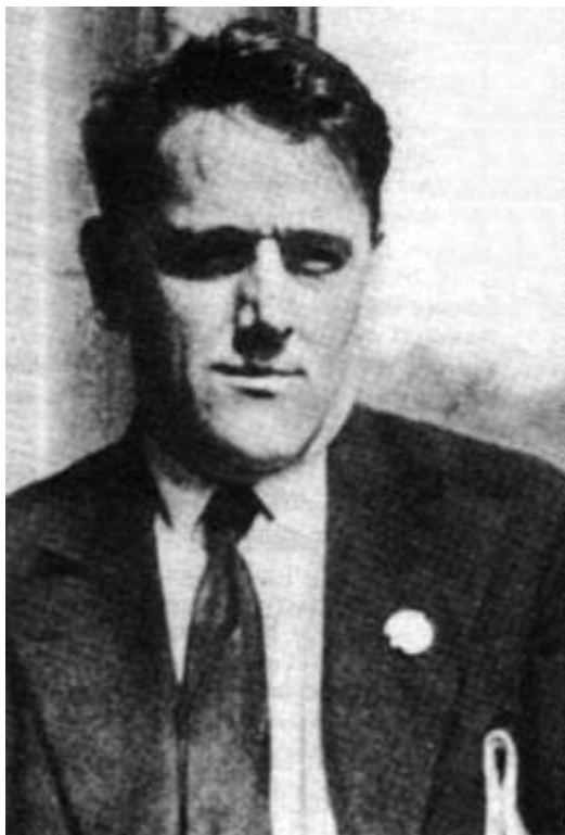
Willi Münzenberg (augusti 1889 – juni 1940)

Det som i själva verket var, om inte nytt, så i varje fall originellt med Amsterdam-Pleyel-politiken, var att man vände sig till ”personligheter” från den borgerliga världen, som skulle sitta på första parkett under dessa kongresser. Med sin grymma penna konstaterade Trotskij: ”Den förenar alla specialister och ’styrkor’: Barbusse, den världsomfattande Münzenberg, hinduiska liberaler, ynkliga demagoger, stora pratkvarnar, engelska lorder och amerikanska änkor, kort sagt ’alla styrkor’ som lider av den sjukdom som kallas ’längtan efter fred...’.” 61 Bland de personligheter som deltog vid dessa festligheter framhöll man oftast den konservativa ledaren för kongresspartiet i Indien, Vallabhai Patel, författaren Henri Barbusse, som en gång skrivit Klarhet ( Clarté ) och Elden och därefter Jésus och snart skulle skriva Staline , den franske radikalsocialisten Gaston Bergery eller den pensionerade tyske amiralen Paul von Schönaich, en militär som blivit pacifist.