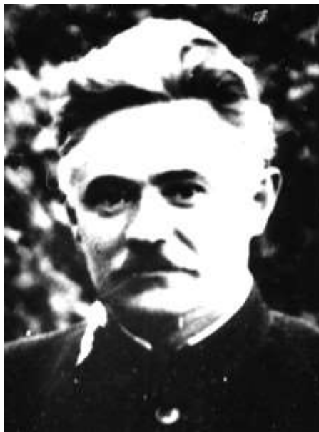
Dmitrij Zakharovitsj Manuilskij 1883–1959

För oinvidga bedömare verkade tionde partikongressen ha lett till en seger för Ruth Fischer. Hon framhöll belåtet att det var första gången i partiets historia som en ledning blev omvald mellan olika kongresser. Rosa Leviné-Meyer, som var närvarande, skriver: ”Valet firades med ett storartat skådespel med henne som obestridlig stjärna, hon trädde in i mötessalen eskorterad av en avdelning från Röd front i eleganta uniformer och som högtidligt följde henne ända till podiet som var smyckat med affischer och fanor och där man grupperade sig bakom henne.” 2 Det var ändå, tillägger Leviné-Meyer, ”Ruth Fischers svanesång”.