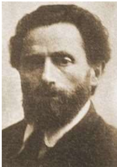
Aleksander (Solomon) Lozovskij (1878–1952) generalsekreterare i Röda fackföreningsinternationalen

Lozovskij de problem hans organisation stod inför för Inprekorrs läsare. 29 Inget saknades på listan över problem men heller inte upplysningar om att Profintern sedan fackföreningarna i Kina hade anslutit sig också hade fått med fackföreningarna i Colombia, Mongoliet och de svarta järnvägsarbetarnas fack i Sierra Leone.