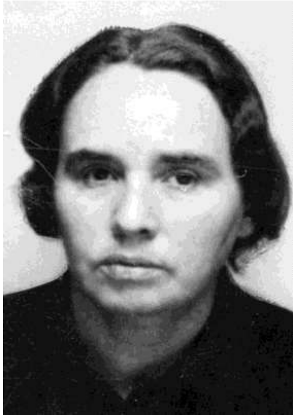
Ruth Fischer (1895–1961)

I själva verket hade Stalin bestämt sig för att skuffa undan Ruth Fischer, som enligt de informationer han fått var alltför lierad med Zinovjev, och ersätta henne med ”bättre kamrater”, som han uttryckte det i ett brev till Bucharin, Manuilskij och Pjatnitskij den 23 juli 1925.