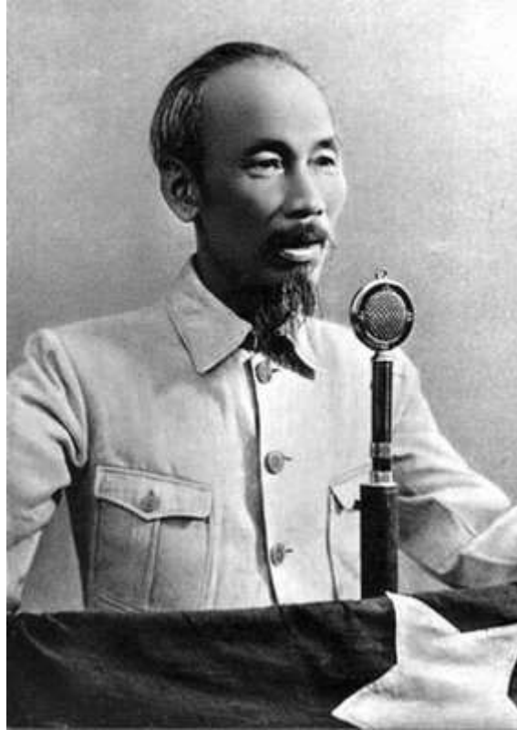
Ho Chi Minh (1890-1969)

Cochinkina. Var det han som låg bakom ett av Kominterns exotiska mirakel när det den 14 januari 1934 delades ut flygblad som hyllade ”de tre L” (Lenin, Liebknecht, Luxemburg) på årsdagen av deras bortgång? 22