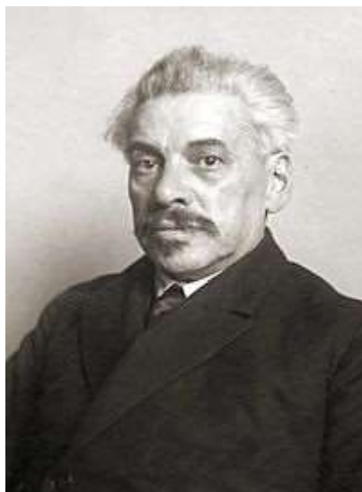
Adolf Warski (1868–1937)

Relationerna med Moskva blev snart dåliga, inte på grund av ”vänsterismen” utan helt enkelt på grund av att den nya ledningen i Polen inom Internationalen betedde sig som en elefant i en porslinsbutik, där KPD fördömdes för att ha ägnat sig åt splittring i samband med att Thälmann ställde upp i presidentvalet, där bulgarerna fördömdes för allianser med demokratiska grupperingar, dvs man tycktes kort och gott överallt gå emot Kominterns politik.