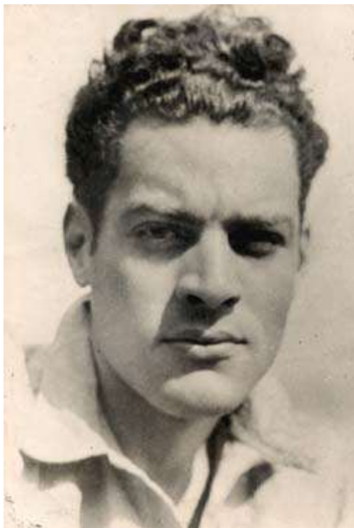
Julio Antonio Mella (1903-1929)