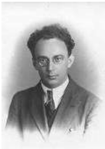
Victorio Codovilla (1894–1970)

Det var således i Moskva som det spanska partiets åttonde ledning på tolv år skulle utses. Den skulle bestå ända till katastrofen 1939 och exilen. Generalsekreterare var José Diaz, en tidigare anarkist från Sevilla. Med undantag av den unge Jesús Hernández, som blev ansvarig för agit-prop, var det män eller kvinnor – som Dolores Ibarruri – som hade stött Bullejos ända till dess exekutiven fördömt dem och som också hade stött honom mot ”instruktörerna”. Kommunistpartiets verkliga ledare var dock Vittorio Codovilla.