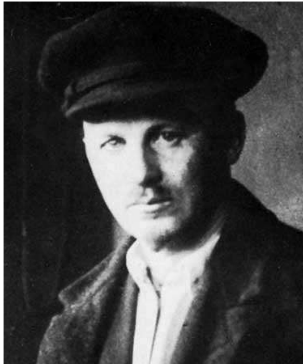
Nikolaj Ivanovitj Bucharin (1888–1938)

Den ”tredje perioden” omdefinierades nu till att betyda slutet på den kapitalistiska stabiliseringen, ett uppsving för proletär militans och en visshet om förestående revolutionära situationer i väst. Socialistiska partier, och reformistiska överhuvudtaget, betecknades som huvudfienden – deras ”fascistisering” sades vara fullständig. Mitt under den tilltagande utrensningen av moderata inom Komintern beordrades utländska kommunistpartier att bryta förbindelserna med socialdemokratiska rörelser, avslöja deras ”socialfascism” och upprätta konkurrerande fackföreningar – att i själva verket splittra den europeiska arbetarrörelsen. Så började Kominterns olycksaliga färd in i extremismen. 2