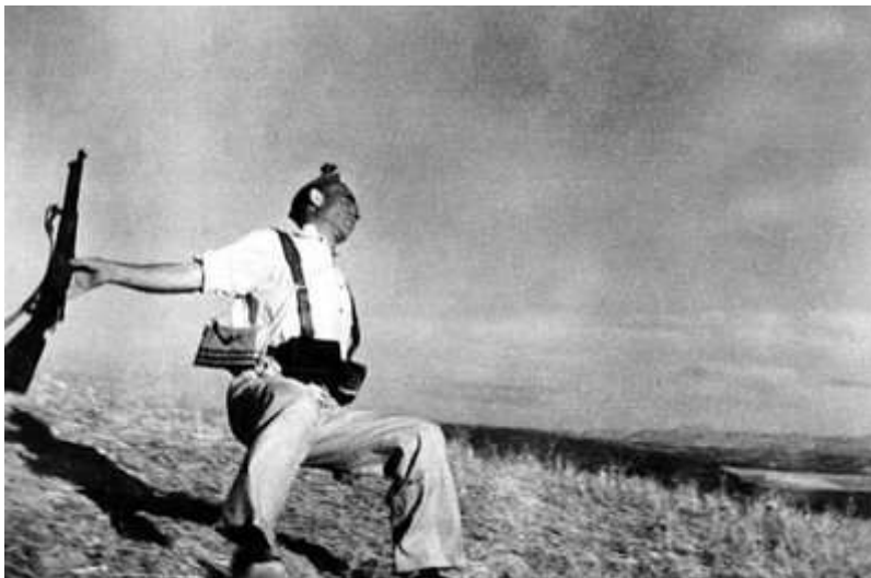
Robert Capas berömda fotografi på milisman som just träffats av en kula