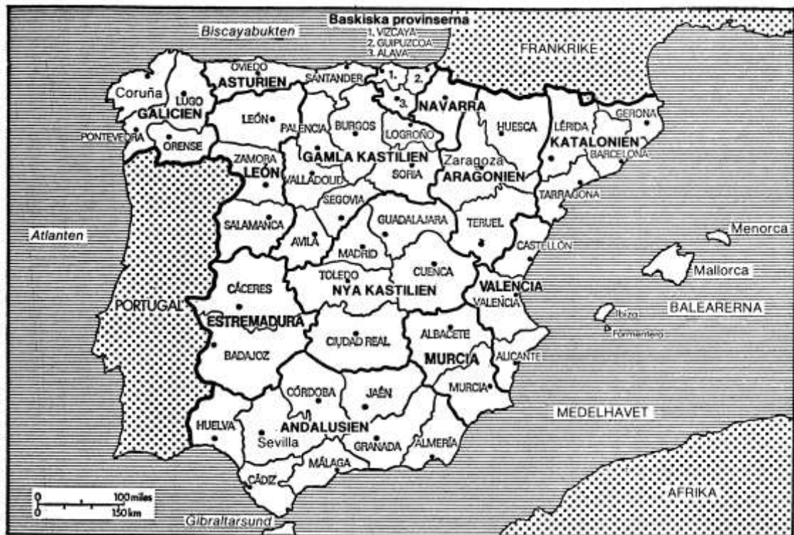
Spaniens regioner och provinser