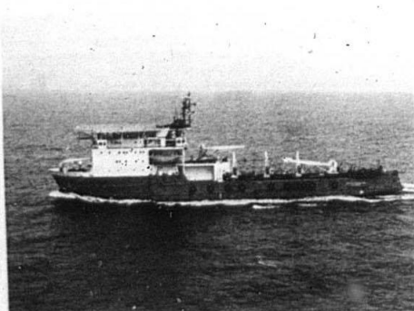
En av de sista båtarna från Öresundsvarvet.

□ — Nej tack, vi vill inte ha några order. Vi ska lägga ned.