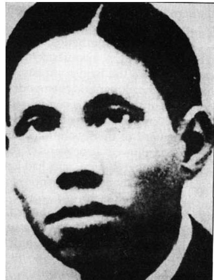
Ta Thu Thau

Etter ett tag bestod den trotskistiska rörelsen av tre skilda grupperingar. En behöll namnet Vänsteroppositionen, en annan var Vänsteroppositionen Oktober (Ta Doi Lap Thang Muoi) och en tredje kallades Indokina-Kommunism (Dong Duong Cong San). Det som skiljde dessa grupper åt var taktiken i samarbetet med stalinisterna.