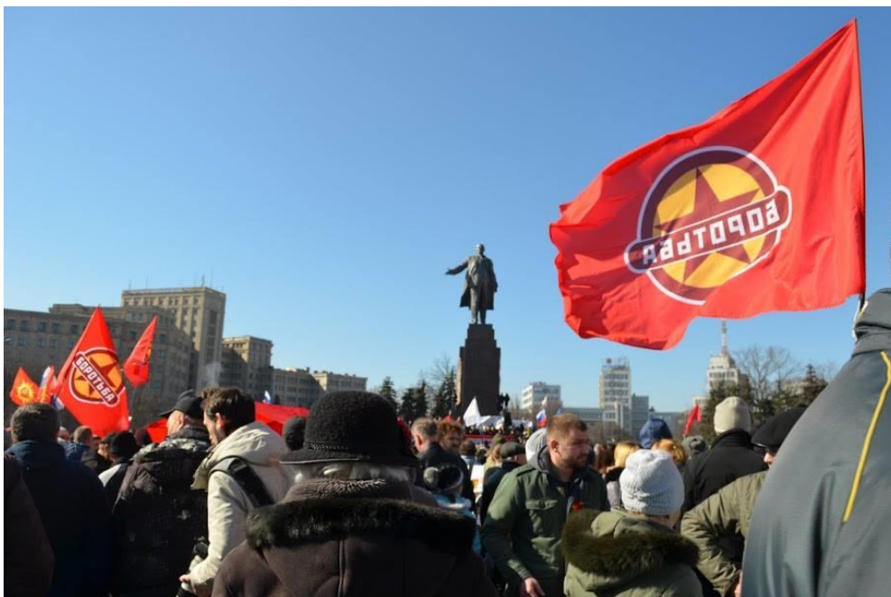
Socialistisk demonstration i Ukrainas näst största stad Charkov

tiotusentals vanliga människor samlades snart på torget utanför, och lyckades besegra och kasta ut kuppmaakarna.