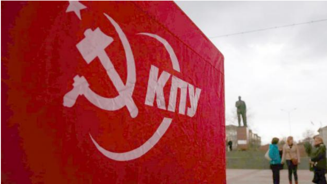
Kommunistpartiet är ute på gatorna i Simferopol på Krimhalvön. I västra Ukraina och i Kiev förföljs kommunisterna

Var maktskiftet i Ukraina legitimt? Är Svobodas antisemitism överdriven? Vem låg bakom krypskyttarna i Kiev? Hur är det med den ukrainska demokratin och yttrandefriheten? Är Europa hotat av rysk expansionism?