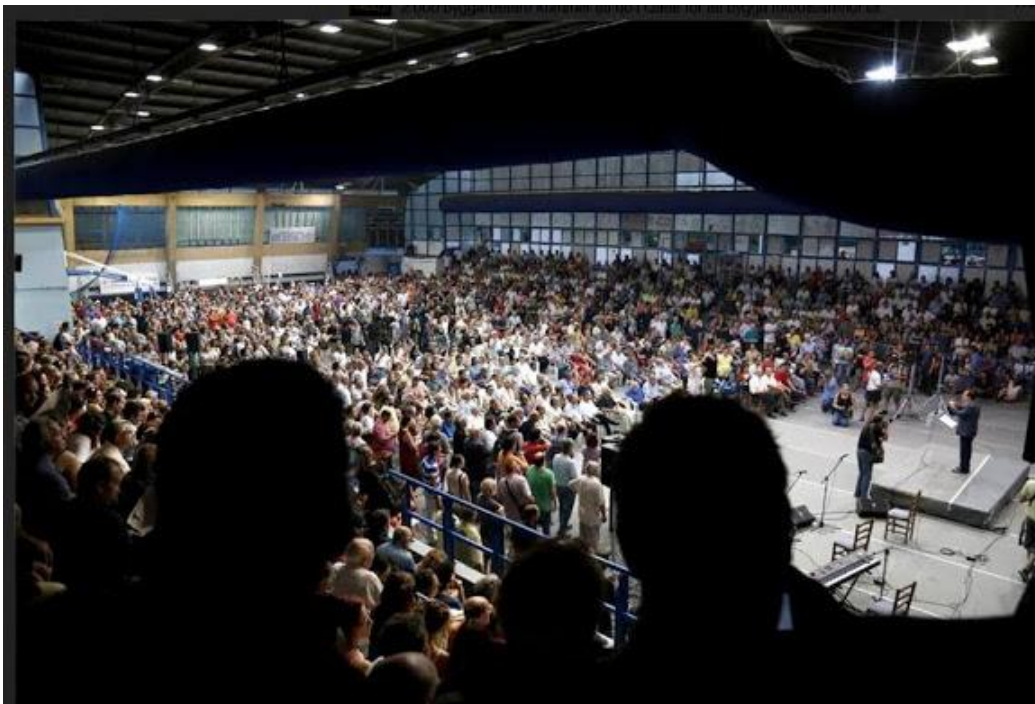
Offentligt opinionsmöte med Vänsterplattformen i Aten (måndag 27/7)

Men, svarar säkert Ehrenberg och många ”realister” med honom. Det fanns och finns ingen majoritet i Grekland för denna socialistiska övergångsstrategi. Om vi bortser ifrån att politik ibland är att vilja och att det kan finnas en väldig dynamik, en verklig klassrörelse, om ett vänsterparti på allvar utmanar makten. Om vi trots denna möjlighet accepterar invändningarna som troliga. Ja, då återstod – och återstår – självklart plan B, nämligen att i ett nyval begära förtroende för detta program, samt att vid en förlust acceptera en återgång till rollen som ett trovärdigt oppositionsparti. Varför i expressfart göra om de misstag som i dag fått Europas socialdemokrati att krypa på sina knän? Bättre att låta de rikas partier ta ansvar för svältprogrammen och själv stärka all folklig självorganisering i väntan på att tidvattnet vänder.