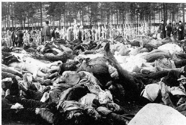
Dödade rödgardister i Tammerfors

Judenitj offensiv mot Petrograd hösten 1919 skulle inte ha kunnat utvecklas till något större hot med ett rött Finland nästgårds. Vidare är det osannolikt att de vita styrkorna i Murmansk och Archangelsk i norra Ryssland överhuvudtaget skulle ha kunnat uppstå – och det är osäkert om Polen skulle ha vågat sig på någon offensiv 1920 mot en starkare motståndare. Kort sagt kunde varje sektor i den ryska revolutionens inbördeskrig ha avlöpt lite smidigare och kostat mindre blod och förödelse – och således skulle utsikterna för en mer gynnsam utveckling efter inbördeskriget ha varit bättre. Med andra ord: en röd seger i Finland kunde ha blivit en betydelsefull tyngd i världsrevolutionens vågskål.