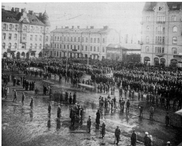
Tillfångatagna rödgardister i Tammerfors