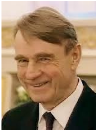
Mauno Koivisto, Finlands president 1982-1994