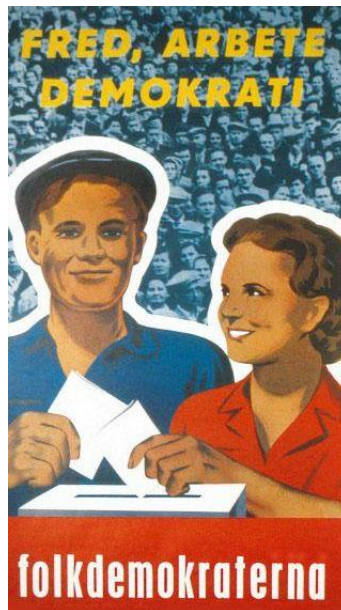
Valaffisch från DFFF

Den finländska borgarklassen och dess socialdemokratiska allierade visade mycket större skicklighet och snabbhet i den nya situationen, och utmanövrerade snart FKP helt och hållet. Kommunisternas deltagande i ”återuppbyggnads”-regeringarna 1945-8 urholkade FKP:s trovärdighet inom arbetarklassen, eftersom syftet med koalitionsregeringarna under denna period var att återställa den finska kapitalismen till funktionsdugligt skick – en målsättning som endast kunde uppnås på bekostnad av proletariatet. 1945 bröts en järnvägsstrejk med hjälp av väpnade styrkor, och en lantarbetarstrejk krossades under nästa år. 1946 frystes lönerna, medan FKP-militer agerade som ekonomiska ”piskor” för högre produktion i fabriker, för att säkerställa en snabb betalning av skadestånden till Sovjetunionen. 1947 återfick socialdemokraterna kontrollen av fackföreningsfederationen, och Zhdanov-kommissionen lämnade landet. Sedan utnyttjade den finländska högern det kommunistiska maktövertagandet i Tjeckoslovakien våren 1948 för att igångsätta en massiv propagandakampanj mot FKP, och i en krisatmosfär vred bourgeoisin inrikesministeriet ur FKP:s händer genom ett vältajmat armé-ingripande. Två månader senare drabbades partiet av ett stort bakslag i valet, och kastades ut ur regeringen. Kommunistiska försök att 1949 reagera genom att starta en våldsam strejkvåg undertrycktes kraftfullt – vilket samtidigt skedde i Frankrike och Italien när en liknande taktik användes för att skyla liknande nederlag.