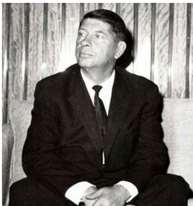
Aarne Saarinen – FKP:s ordförande 1966-1982

En stor del av förklaringen var Sovjetunionens massiva tryck på majoriteten mot varje försök att kasta ut minoriteten och definitivt splittra partiet. Sovjets traditionella inflytande över FKP var kvalitativt större än i de stora västeuropeiska partierna och majoritetsledningen kring Aarne Saarinen var inga ”eurokommunister” som vågade stå emot trycket från Moskva, utan de var fortfarande till 90% traditionella stalinister som inte hade någon riktig kapacitet att stå emot ”storebror”. Gång på gång klampade SUKP:s tungviktare in och tvingade FKP:s ovilliga majoritet till nya kompromisser – de sovjetiska massmedia uttryckte ofta öppet stöd för den brezjnevitiska minoriteten och bakom kulisserna finansierade SUKP FKP-minoriteten med c:a 80 miljoner finska mark åren 1972-82.