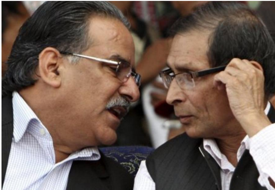
Ordförande Prachanda och vice ordf. Kiran i ledningen för olika fraktioner i maoistpartiet

Premiärministern från CPN (UML) – Communist Party of Nepal (Unified Marxist Leninist) – har upprepade gånger ombetts att avgå av oppositionen i kongressen liksom av medlemmarna i sitt eget parti. Mitt i kraven på hans avgång, och trots hans egna preferenser, har han tvingats integrera den största koalitionspartnern – maoisternas nya ministergrupp – i den sex månader gamla regeringen. Nu vill oppositionen ha omedelbart genomförande av den uppgörelse i fem punkter som undertecknades av de tre största partierna den 21 maj, medan konstituerande församlingens tidsperiod förlängs med tre månader. Det innefattar premiärministerns avgång för att bereda väg för en ”nationell enhetsregering” liksom att förbereda det första förslaget till den nya konstitutionen och att integrera de maoistiska kämparna.