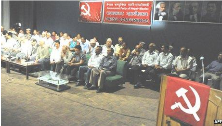
Det nya maoistpartiet konstitueras

partiets tidigare namn Nepals kommunistiska parti (maoister) i ett försök att säkra dess kontinuitet och kreditiv. Baidya – också känd som Kiran – beskyllde ledningen för att ”ge upp den revolutionära andan”, släppa partiets gamla krav på en federal konstitution baserad på landets etniska grupper och att göra eftergifter åt ”indisk expansionism”.